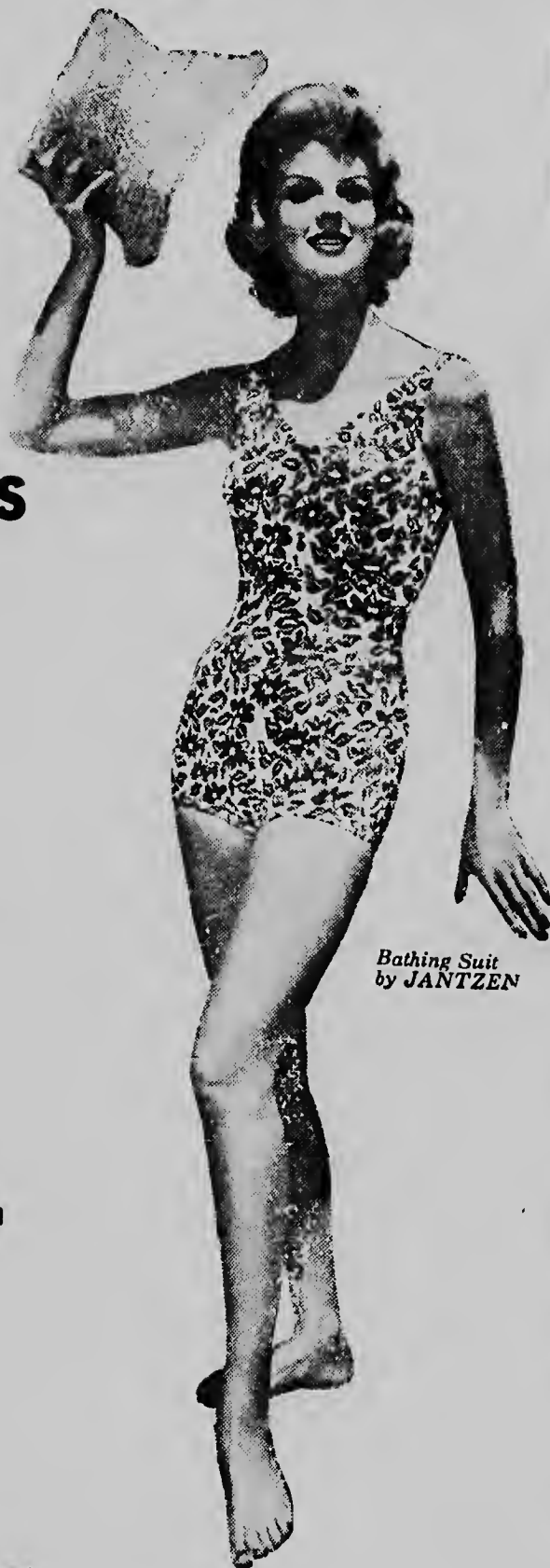
Bathing Suit by JANTZEN

Awe mainta nan lo huelga den capital di Panama durante un cuarto di ora como un demostracion publico.